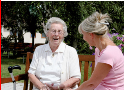
Seniorenheim und Kurzzeitpflege